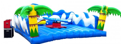
Tabla de surf mecánica con diferentes niveles de dificultad.